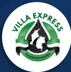
TRANSPORTADORA VILLA EXPRESS S.A.S. Villagarzon